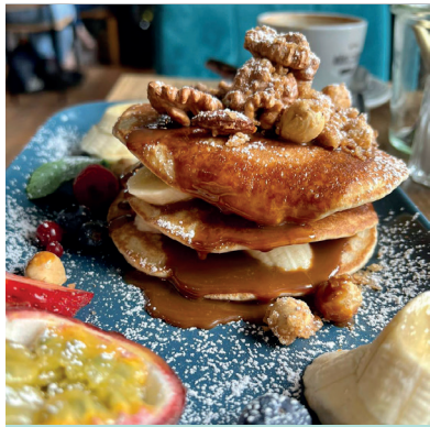
PANCAKE BUENOS AIRES

mit Dulce de Leche [argentinisches Milchkaramell], Banane & karamellisierten Nüssen [we. gl. mi. ei. sc.] 9,90 €